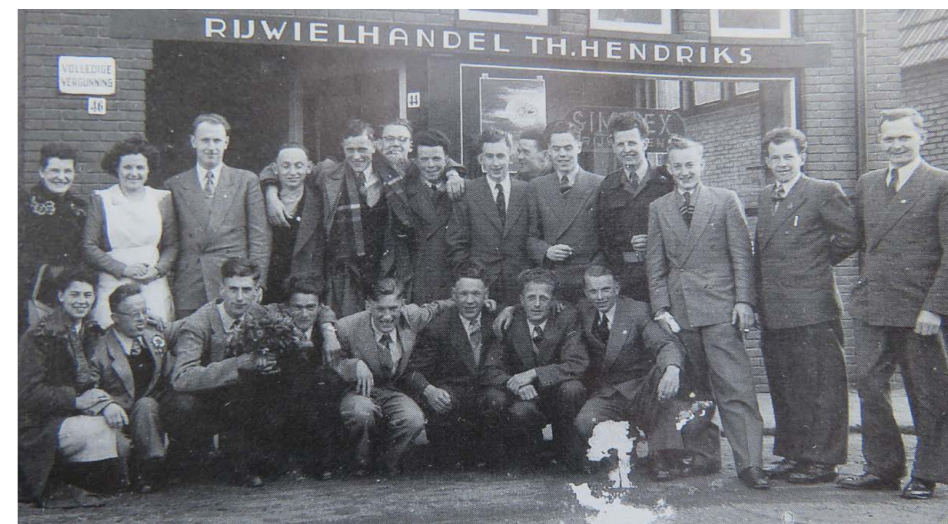
't Swaantje, jarenlang het clublokaal van Achates

Nog even iets over het café. In 1979 besloten Johnny en Lies de inrichting van het oude café te renoveren naar moderne maatstaven. Pieter Kortekaas bedacht de