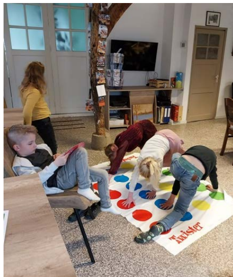
De jeugd is er ook, spelletjes middag in huiskamer de Prôst

Hoewel het voorjaar maar moeizaam op gang komt start in april ook weer het fietsseizoen. Niet alleen voor de wielclubjes maar zeker ook voor onze eigen duofiets! De duofiets is voor iedereen in Ottersum te leen, zo kun je ook als je wat minder mobiel bent lekker blijven fietsen. Aan de uitleen van de duofiets zijn geen kosten verbonden. Je kunt gezellig met je buurvrouw, vader, vriendin gaan fietsen of met een van onze fietsmaatjes. Dit kun je aangeven wanneer je de fiets reserveert. Je kunt de duofiets reserveren via www.dagottersum.nl . Daar vind je ook wat meer uitleg en kun