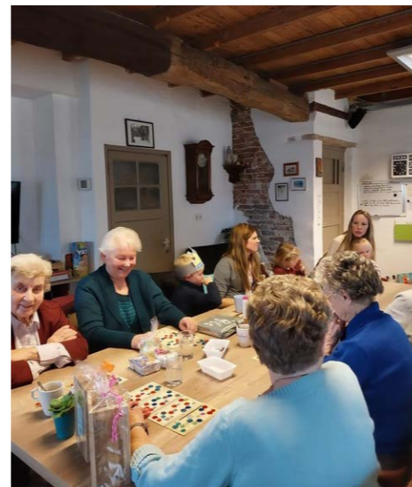
Er werd fanatiek meegedaan met de bingo, door jong en oud

Afgelopen periode hebben we weer mooie matches kunnen maken vanuit Accent op ieders Talent. Zo hebben we voor een mevrouw een sleutelkuisje opgehangen, een wasmachine is in de maak, we hebben weer nieuwe gasten mogen ontvangen