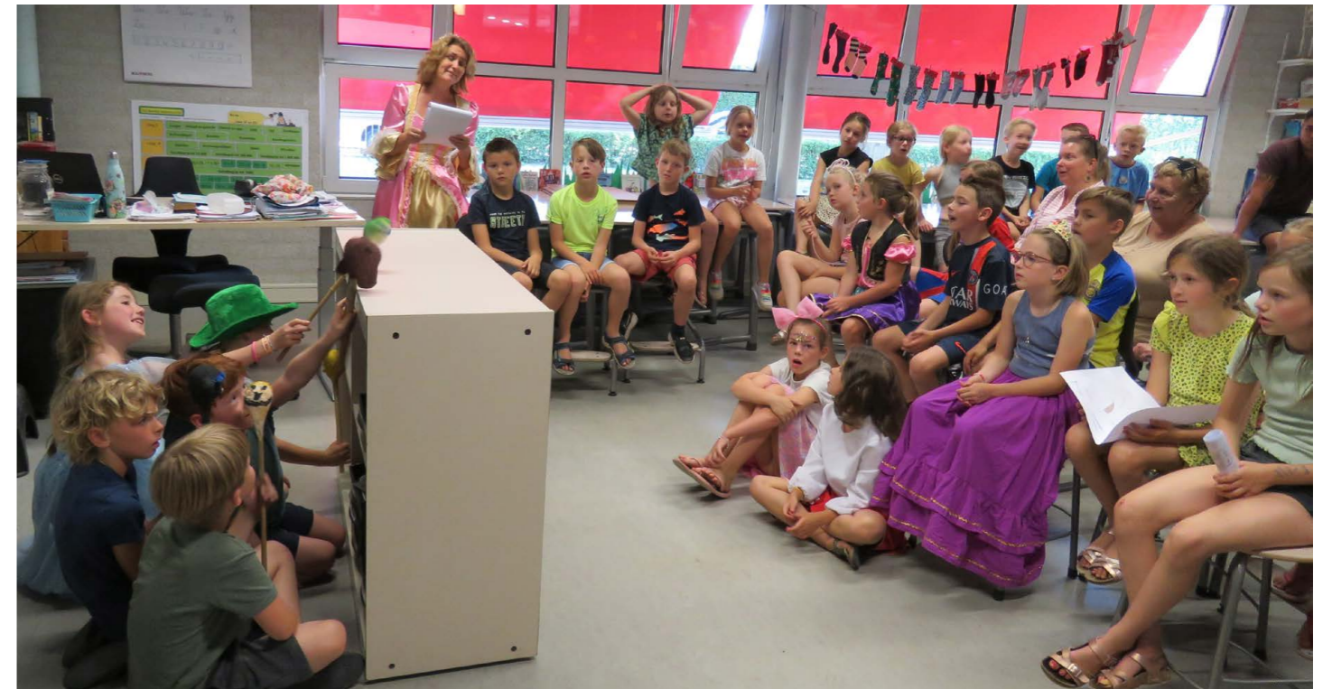
De kinderen achter de kast brachten met hun stokpoppen het sprookje tot leven

Door Jos Heijligers - Het getal 7 is een magisch getal dat veel voorkomt in sprookjes. Wie kent niet de zeven geitjes die de wolf te slim af zijn, of de zeven dwergen die Sneeuwwitje in huis nemen. Of bijvoorbeeld de zevenmijlslaarzen waarmee Klein Duimpje met zijn broers – samen zeven jongens – aan de reus ontsnapt. 07-07, zeven juli, is dan ook uitgeroepen tot Nationale Sprookjesdag. Op deze dag sloot De Brink hun sprookjesproject af, waar kinderen en leerkrachten een aantal weken aan werkten.