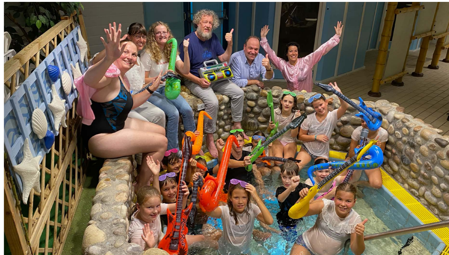
De leerlingen tijdens hun kamp weekend

Door Jos Heijligers - In de jaren tachtig veranderde het muziekonderwijs voor kinderen. Er kwamen professionele muziekscholen en goede muziekdocenten. In de jaren negentig kwam er ook mondjesmaat muziek materiaal dat geschikt was voor kinderen op de markt. Kinderen konden de muziekstukken 'ook-zelf-lezen', ze werden vereenvoudigd. Dit stimuleerde de jonge kinderen om als hobby voor de muziek te kiezen die ze kenden van fanfares en harmonieën. Deze ontwikkeling zorgde ervoor dat harmonie St. Caecilia Ven-Zelderheide Ottersum zo'n 25 jaar geleden een leerlingen orkest oprichtte. Het volgend jaar staat Harm Vullings al een kwart eeuw als volwaardig dirigent voor het leerlingorkest. Hij werkt in het onderwijs en heeft zijn hele leven lang al affiniteit met blaasmuziek.