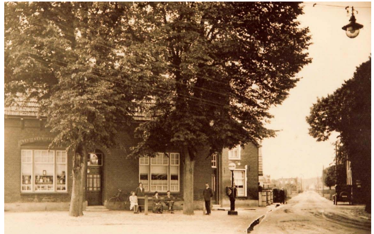
Café Hoek van Holland met winkel en benzinepomp eind jaren 20