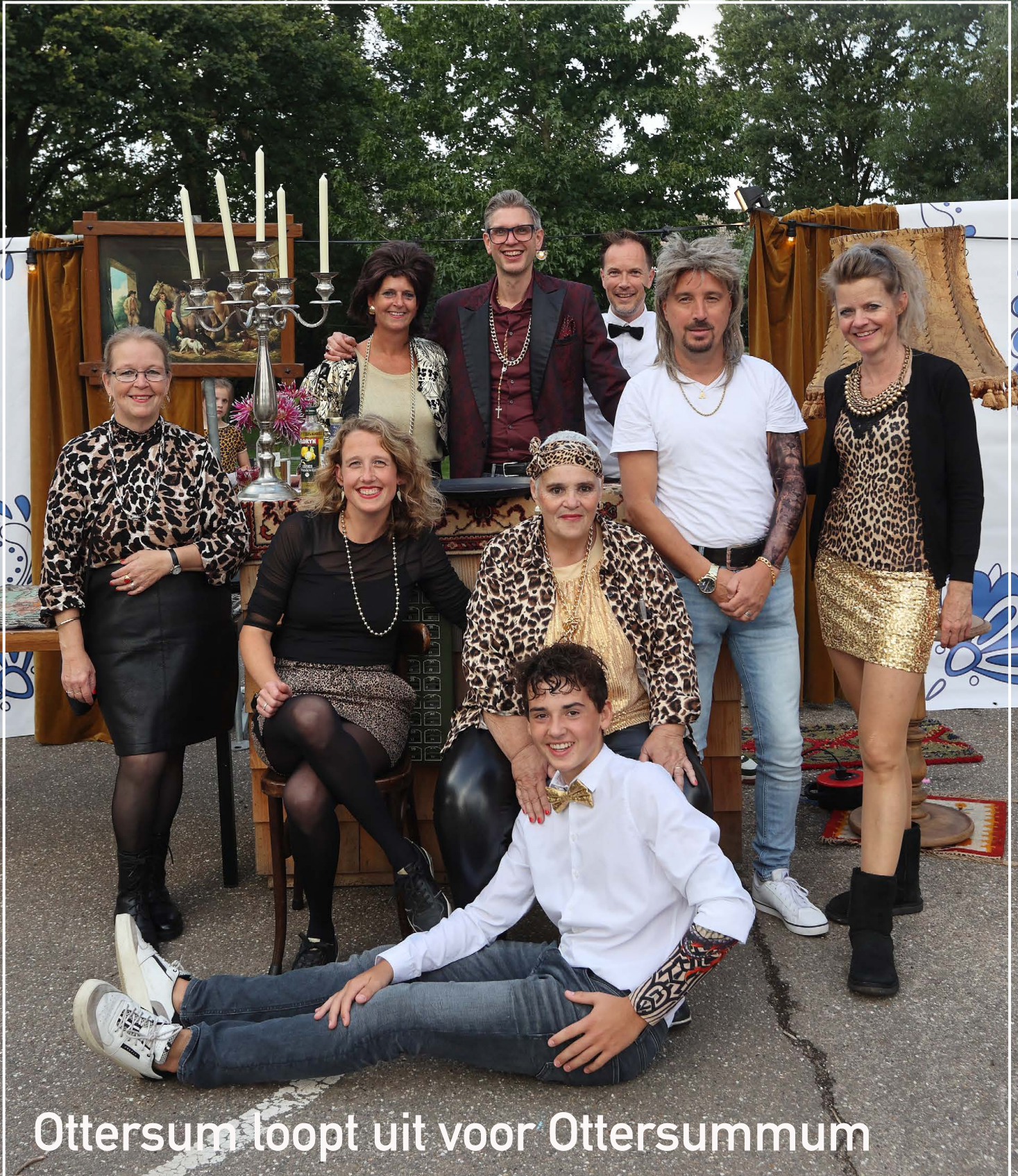
Ottersum loopt uit voor Ottersummum