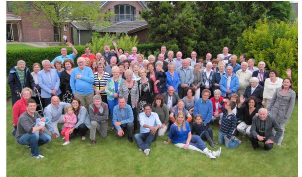
De Niersbuurt bij het 50-jarig jubileum in 2013

Ondanks de verschuiving van de jaren organiseerde de Niersbuurt echter veel activiteiten. De feestavond, een jaarlijkse busreis voor de kinderen naar de speeltuin in Wanroij, een sjoeltoernooi, speur- en fietstochten, bowlen, viswedstrijd, kanotocht op de Niers en in de zomermaanden een overheerlijke barbecue. Toen de kinderen gingen studeren, verhuisden of niet meer deelnamen aan de activiteiten koos het bestuur voor andere activiteiten, die beter pasten bij de veranderende buurtsamenstelling. Ze gingen naar stadjes in de buurt voor een stadswandeling (b.v. naar Grave en Xanten), met een IVN-gids in de vroege ochtend wandelen in het nabije bos en het