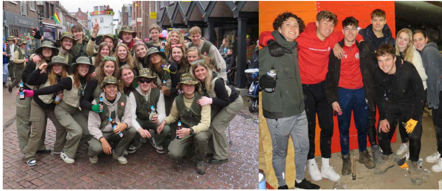
Op de foto links CV Hoppe Thee tijdens de optocht van Gennep afgelopen carnaval, rechts CV Net Niks tijdens de bouw van hun wagen.

Jonge carnavalsgroepen zijn al sinds jaar en dag vertegenwoordigd tijdens carnaval in Ottersum. Toch lijkt het zelf bouwen van een carnavalswagen tegenwoordig minder populair dan voorheen. Jos Heijligers ging op pad bij twee jonge Ottersumse vriendengroepen die nog wel zelf bouwen en deed verslag.