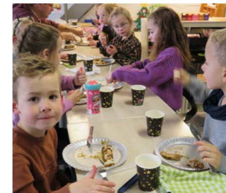
De kinderen aten stapels pannenkoeken, de juffrouw keek er met verbazing naar!

Een populaire uitdrukking is in dit verband: 'De kinderen worden gezien op deze school'. Toch liggen de eisen van het onderwijs best wel hoger dan b.v. tien jaar geleden. Lean werkt samen met veel jonge collega's, ook dat ervaart ze als heel positief.