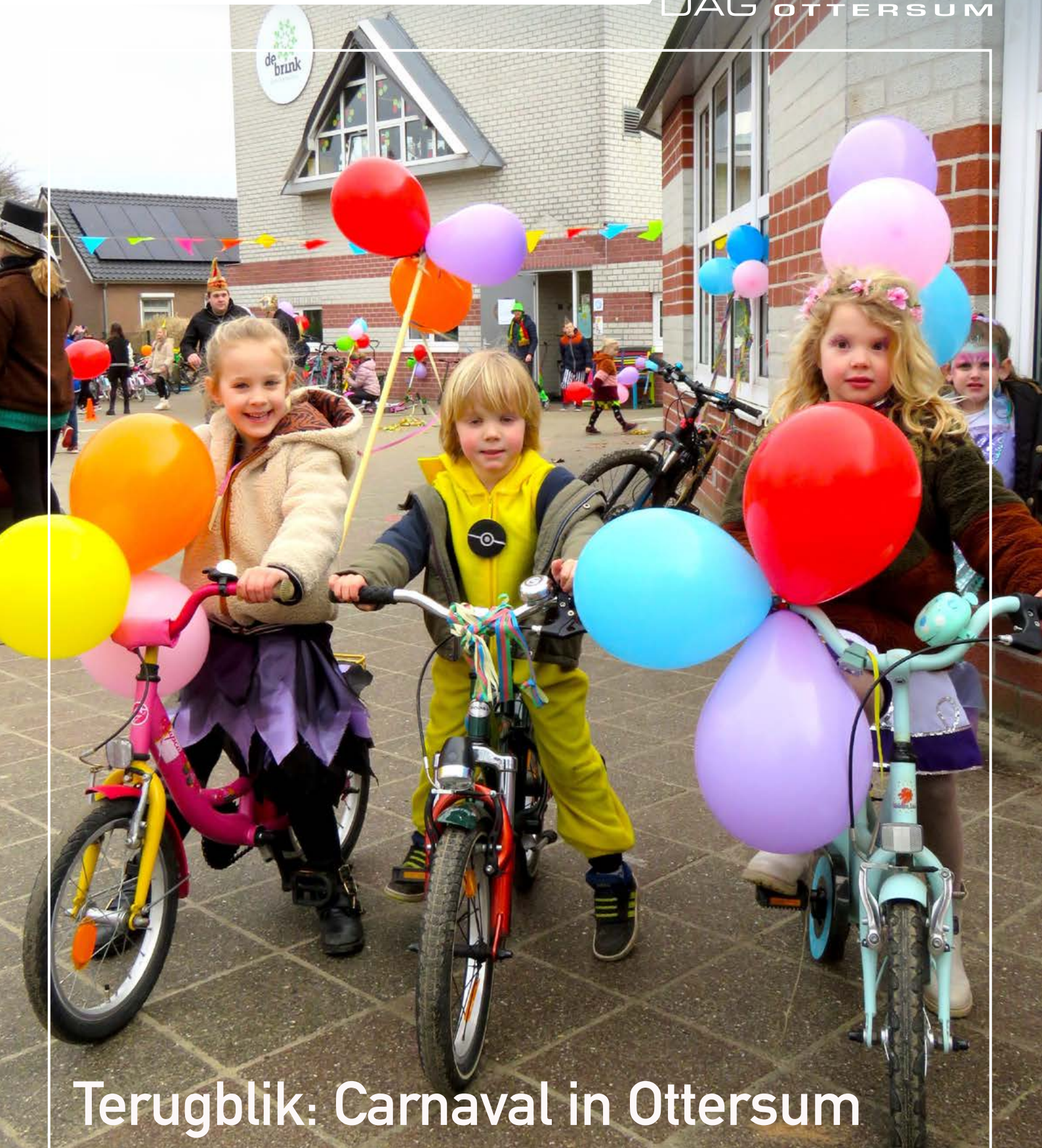
Terugblik: Carnaval in Ottersum