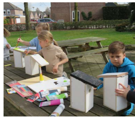
Vogelhuisjes in de maak voor 't voorjaar