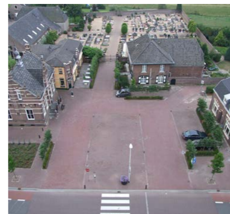
Zo kan het ook: een autovrij-plein