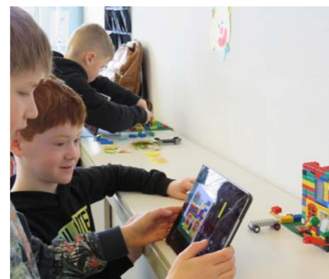
Foto's maken op de iPad van lego