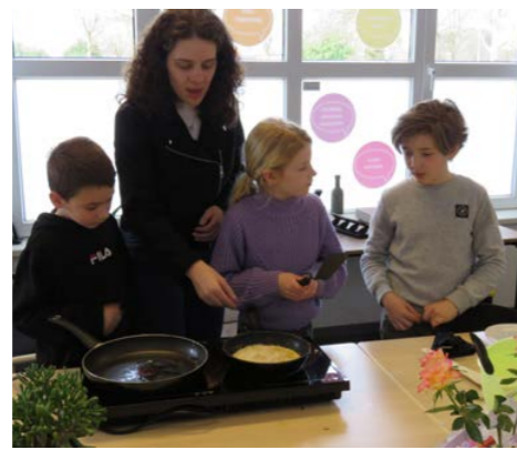
Pannenkoeken bakken: gezellig & leerzaam