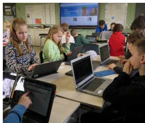
Programmeren als creatieve opdracht