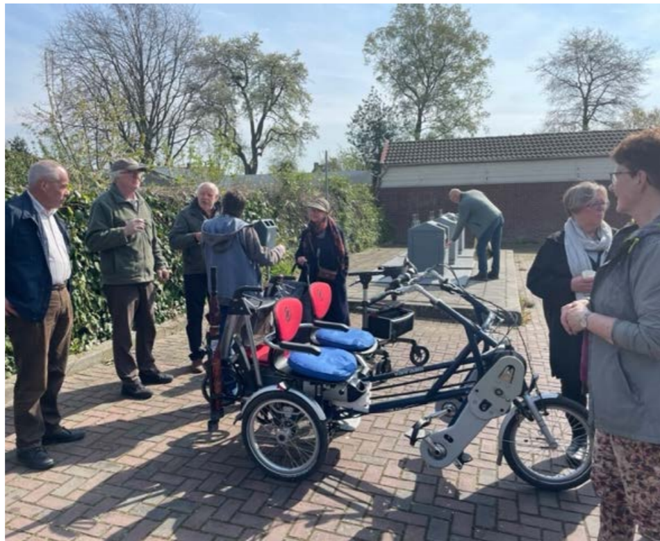
De demonstratie van de Duo-fiets werd goed bezocht, 22 april jl.

Kijk op de website www.dagottersum.nl voor het maken van een reservering.