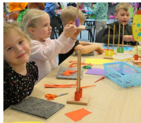
Werkend aan de haan met houten pootjes