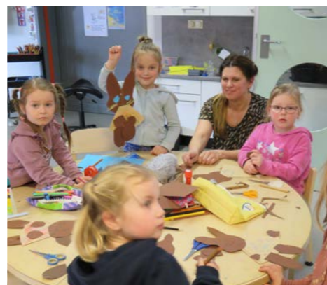
Een paashaas wordt vol trots getoond