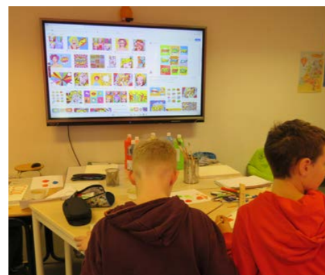
Op het digibord aan de slag met popart