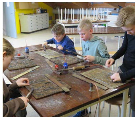
Enthousiast werd er gesoldeerd

ronde en zijn erg betrokken. Zeker omdat ze zelf mogen kiezen en inschrijven voor het onderdeel dat hen aanspreekt. Tja, vol is vol, maar aangezien ze tien keer kunnen kiezen voor een Kunstkriebel is er altijd wel een mogelijkheid om als eerste te kiezen. Aan het einde van het schooljaar evalueert de werkgroep het project en dan valt de keuze of Kunstkriebels ook volgend jaar doorgaat. Alle creatieve opdrachten zijn welkom! Wie dit leest en enthousiast wordt, kan zich aanmelden op De Brink. Hieronder een aantal foto's van de activiteiten.