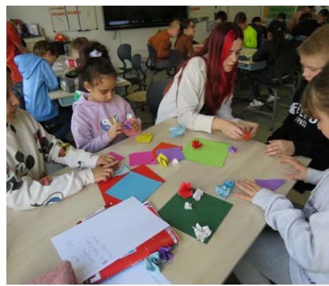
Groep 5 en 6 aan de slag met origami